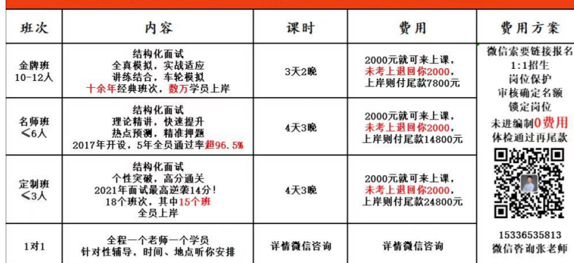
展鸿2022年杭州医疗卫生面试培训课程（未进编制0费用）