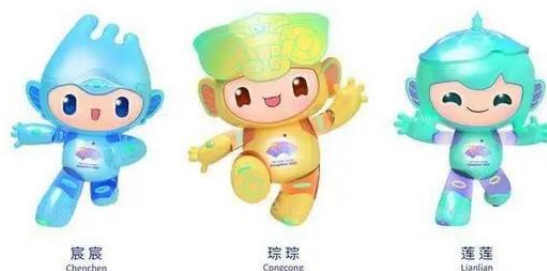
杭州2022年第19届亚运会吉祥物 Mascots of the 19th Asian Games Hangzhou 2022