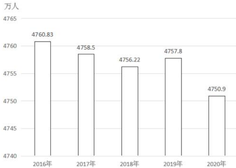
2016~2020 年末 S 省就业人口数量

1952.62 万人，与 2019 年末相比，第一、第二产业就业人口比重分别下降 0.7 个、0.1 个百分点，第三产业就业人口比重上升 0.8 个百分点。