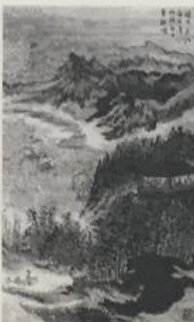
杜甫诗意图（中国画 现代）陆俨少 楼下长江百丈清，山头落日半轮明。