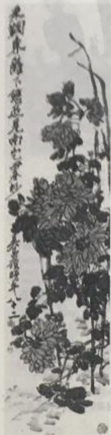
诗意图（中国画 现代） 吴昌硕 采菊东篱下，悠然见南山。