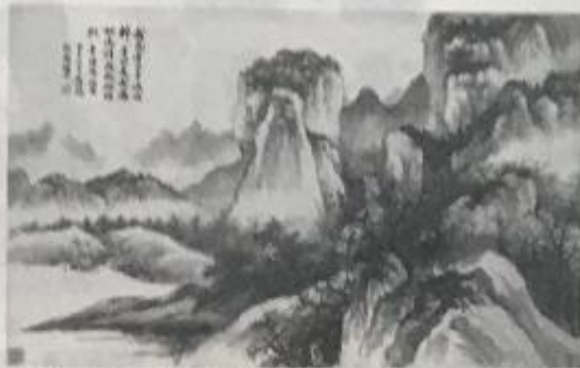
稼轩河意图（中国画 现代）吴湖帆 我见青山多妩媚，料青山，见我应如是。情与貌，略相似。